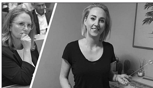
Minister Agema en collega NEI-coach